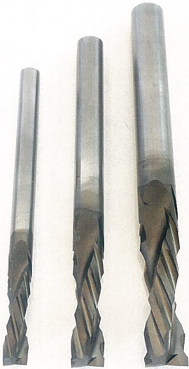
▲小径刃物×浅溝加工×耐久性=DIAコート浅溝エンドミル「MIX-mill(ミックスミル)」

新製品「MIX-mill(ミックスミル)」は、押さえ込み刃を刃先ギリギリまで利かせて開発した