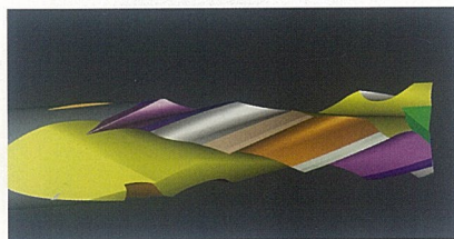
▲シミュレーション画像

正逆リードと呼ばれるエンドミルは、ダイヤモンド分削刃か全超硬のスパイラルビットが主流であるが、「ダイヤモンド分削刃で小径のものはないのか?」と云うユーザーニーズに応えるべく、ダイヤモンド分削刃と超硬スパイラルビットの長所だけを取入れミックスした刃物開発に取り組んだ結果、ついに「DIA(ダイヤ)コート浅溝エンドミル」と云うφ10以下の小径製作が可能で且つダイヤの耐久性を備え、浅溝加工時は表面のめくれやバリが